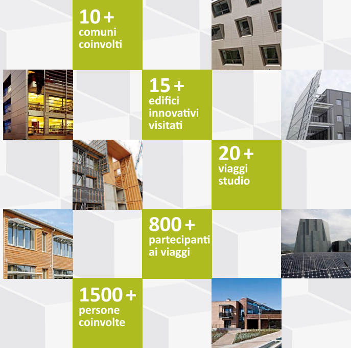
FIGURE DI RIFERIMENTO

I principali gruppi di riferimento del progetto AIDA sono i comuni e i professionisti in campo edile. Una particolare attenzione è stata riposta a soddisfazione delle necessità e dei bisogni locali delle nazioni coinvolte, che tuttavia variano molto.